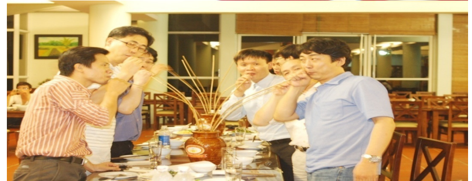
Workshop on Opinion Mining with The Korean Saltlux Company, Oct. 2010; Drinking the Vietnamese traditional "CAN" wine together